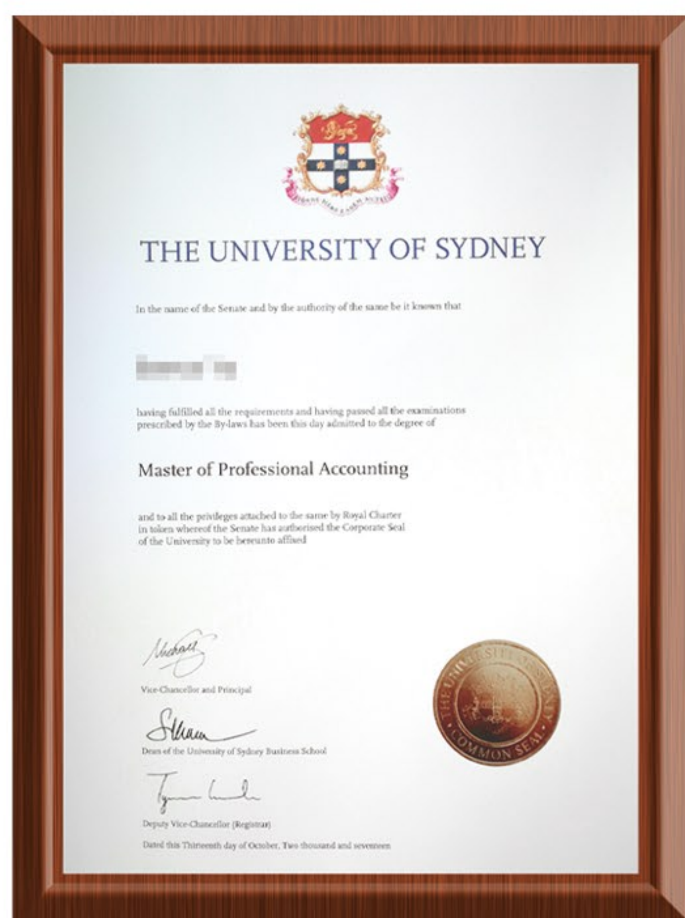
项目毕业生硕士学位证书样式