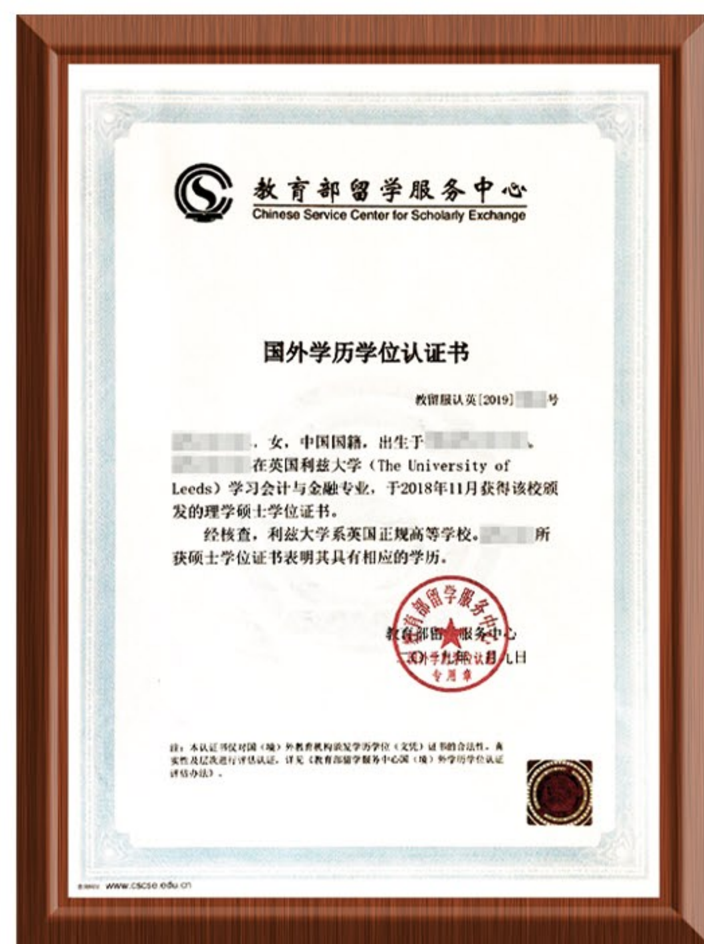
项目毕业生硕士学位 (硕士研究生学历) 认证书样式