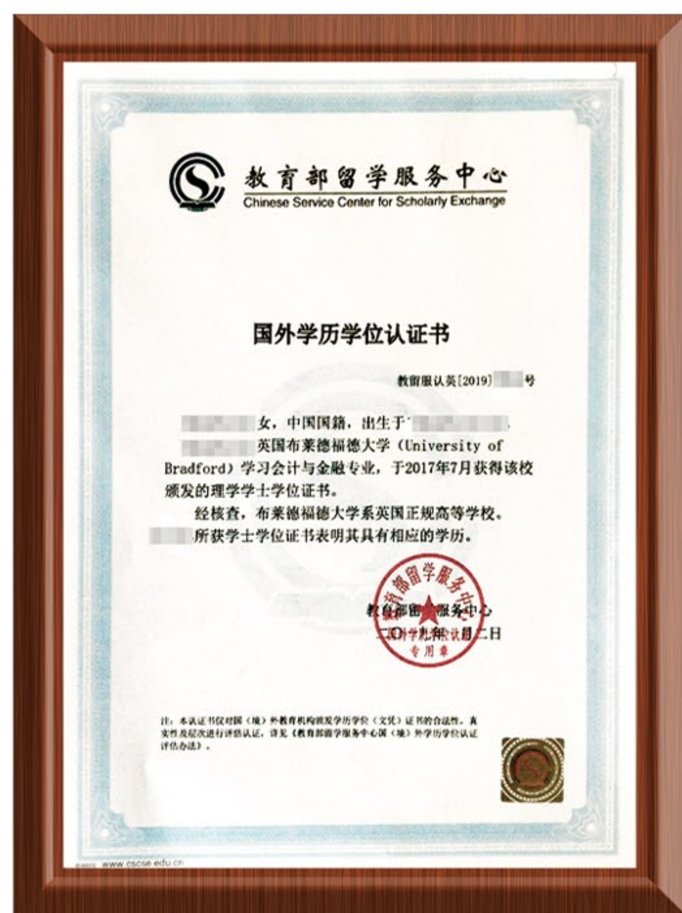
项目毕业生学士学位 (本科学历) 认证书样式